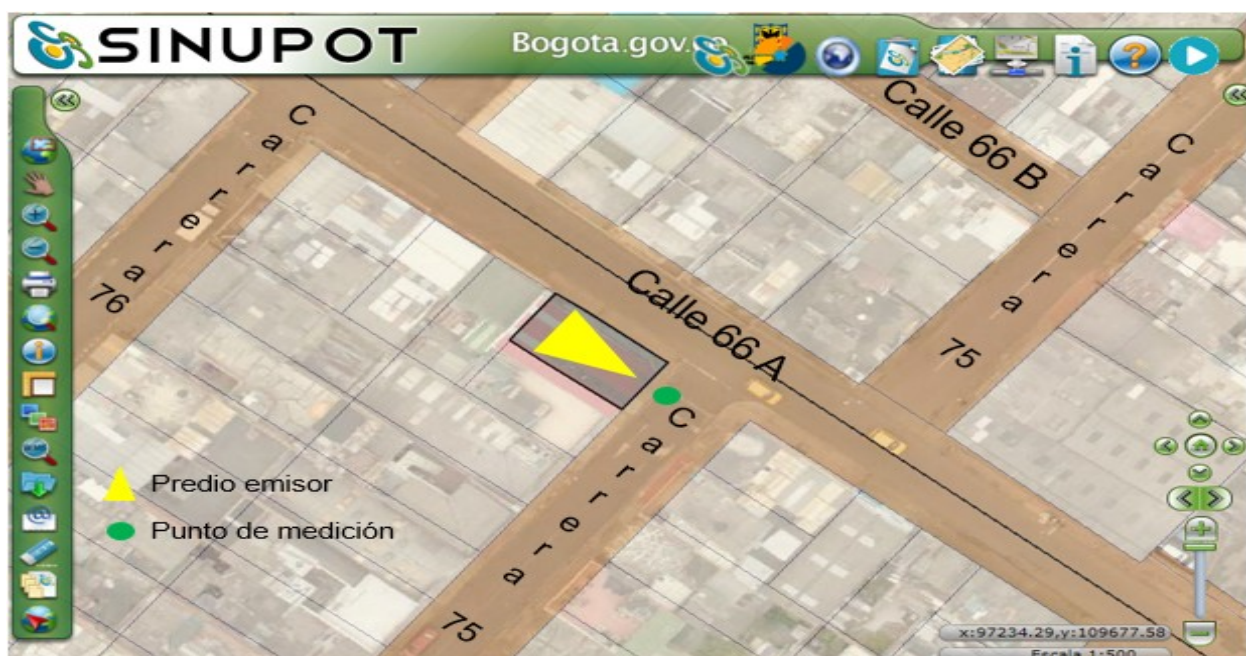
Figura 1. Ubicación del predio emisor y punto de medición.

Nota 5: Datos suministrados en el Anexo No 6. Reporte SINUPOT